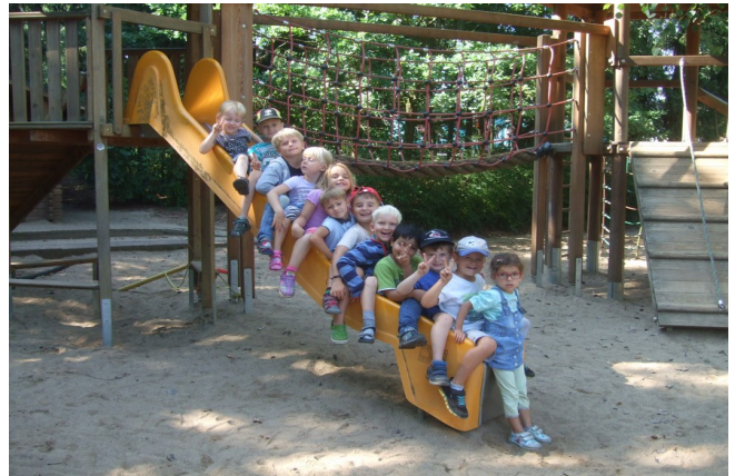
Rutschen für die Großen

Die Kindertagesstätte St. Willehad liegt in dem in den siebziger Jahren entstandenen Teil der Gemeinde Groß Grönau, an einer von der Hauptstraße abzweigenden Nebenstraße. In der Nachbarschaft befinden sich eine Ladenzeile, eine Apotheke, ein Arzt, sowie ein Zahnarzt.