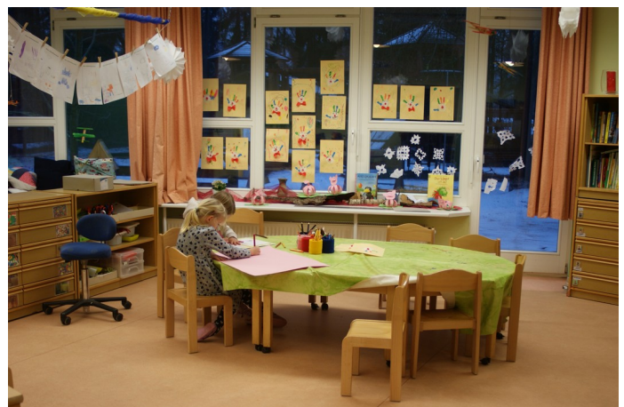
Gruppenraum im Elementarbereich

Die Räumlichkeiten bieten den Kindern vielfältige Anreize für unterschiedliche Erfahrungen im ganzheitlichen Sinn für Geist, Körper und Seele. Dafür gibt es Spielzeuge, die zur Bewegung herausfordern, Spielzeuge für Spannung und Entspannung, Spielzeuge für Stille und Konzentration. Unsere Kitaräume