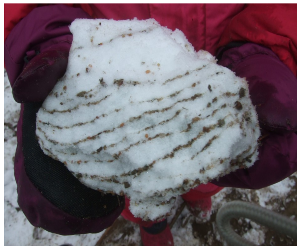
Wie kommen die Streifen in den Schnee?

Dinge zu betrachten und sie danach verstehen zu wollen, ist eine natürliche Verhaltensweise von Kindern. Durch eigenes Beobachten, Ausprobieren, Prüfen, Beschreiben, Vergleichen, Konstruieren, Ordnen und Bewerten gewinnen Kinder zunehmend eine Vorstellung davon, wie die Welt, in der sie leben, funktioniert. Die Kinder