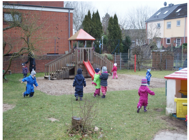
Rutschen für die Kleinen

Durch gute Busverbindungen und die Nähe zur Hansestadt Lübeck sind Theater, Museen und ähnliche Veranstaltungsorte, sowie der Flughafen leicht zu erreichen.