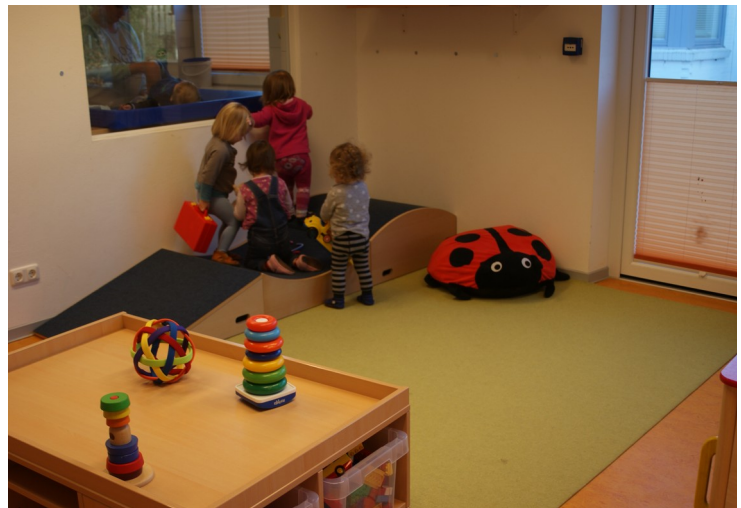
Spielende Kinder vor dem Fenster zum Wickeltisch

Ergänzt werden die Gruppenräume durch mehrere Küchenzeilen und im Elementarbereich durch eine zentrale Halle. Darüber hinaus kann von allen das Gemeindehaus genutzt werden. Es gibt einen Mitarbeitendenraum und einen Gesprächsraum für Elterngespräche.