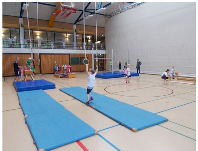
Turn- und Bewegungsspiele in der Grönuhallen

Kinder sollen in der Kita die Welt durch Bewegung und Sinneserfahrungen entdecken und dabei ein wachsaues Körpergefühl entwickeln. Sie sollen unterscheiden können zwischen Wohl und Unwohl, zwischen gesund und krank.