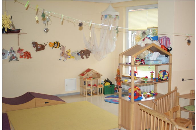
Gruppenraum in der Krippe

den Krippenbereich mit Gruppen-, Schlaf- und Sanitär-räumen, den Elementarbereich mit Gruppen- und Sanitär-räumen, sowie einem Nebenraum, und einem entsprechend gegliederten Außenbereich.