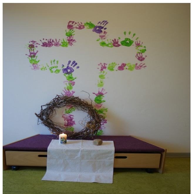
Wochenandachtstisch in der Krippe