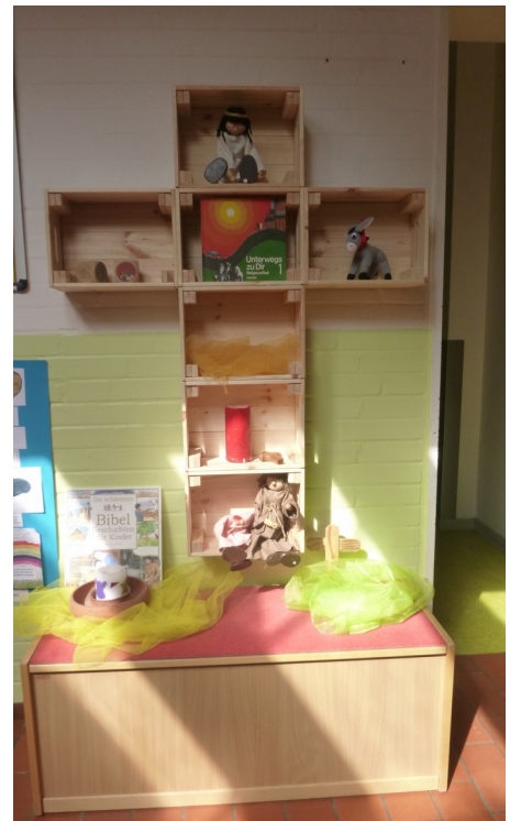
Wochenandachtstisch im Elementarbereich

Wiederkehrende Rituale unterstützen uns darin, uns immer wieder daran zu erinnern, dass Gott uns begleitet. Dazu gehören auch Kinderbibelwochen, Tischgebete, gemeinsames Singen, das Erleben von religiösen Bräuchen, wöchentliche Andachten. Um mit den Kindern christliche Gemeinschaft zu leben, gibt es in unserer Kita Rituale, wie die Begrüßung der neuen Kinder in einem Gottesdienst, das Gebet,