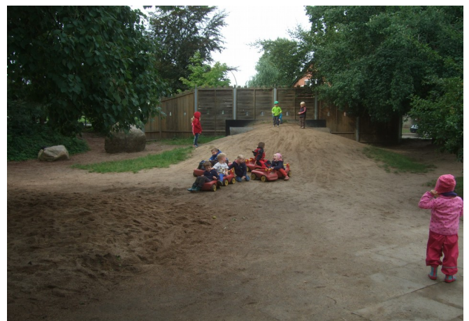
Hügel mit Tunnel

Die Außenanlagen sind etwa 1800 qm groß und erstrecken sich hinter der Kita. Die großzügig angelegten Sandkisten und Spielgeräte werden durch Büsche und Bäume unterteilt und eingerahmt. Zum Spielen, Klettern und Balancieren laden insbesondere ein Hügel mit